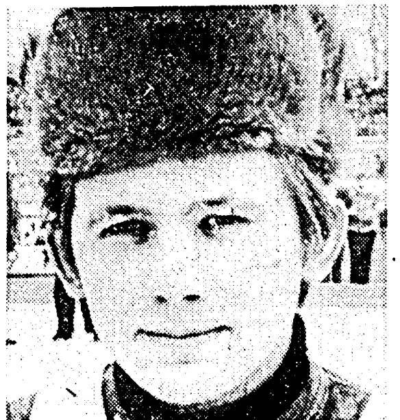
• VLADIMIR LIOUBICH... vice-wereldkampioen...

De kwaliteit van het rijdersveld kan wellicht het beste worden geïllustreerd door de belangrijkste coureurs en hun wapenfeiten op een rijtje te zetten. In de eerste plaats moet Sergey Tarabanko worden genoemd. De Rus werd wereldkampioen 1975, 1977 en 1978. Tarabanko werd het vorig jaar onttoond